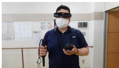
画像2）暗所視支援眼鏡装着時