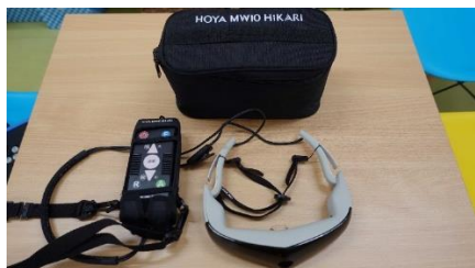
（画像1）暗所視支援眼鏡

愛知県内で暗所視支援眼鏡を日常生活用具助成対象としている自治体、販売店、デモ機が配備されている眼科などの最新情報は、メーカーのWEBサイト（ https://vixon.jp/shop ）に掲載されていますのでご確認ください。